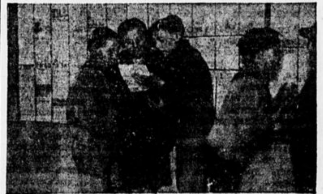
ДЕЛЕГАТЫ 2-Й МЕЖД. КОНФЕРЕНЦИИ ЧИТАЮТ СТЕНГАЗ.