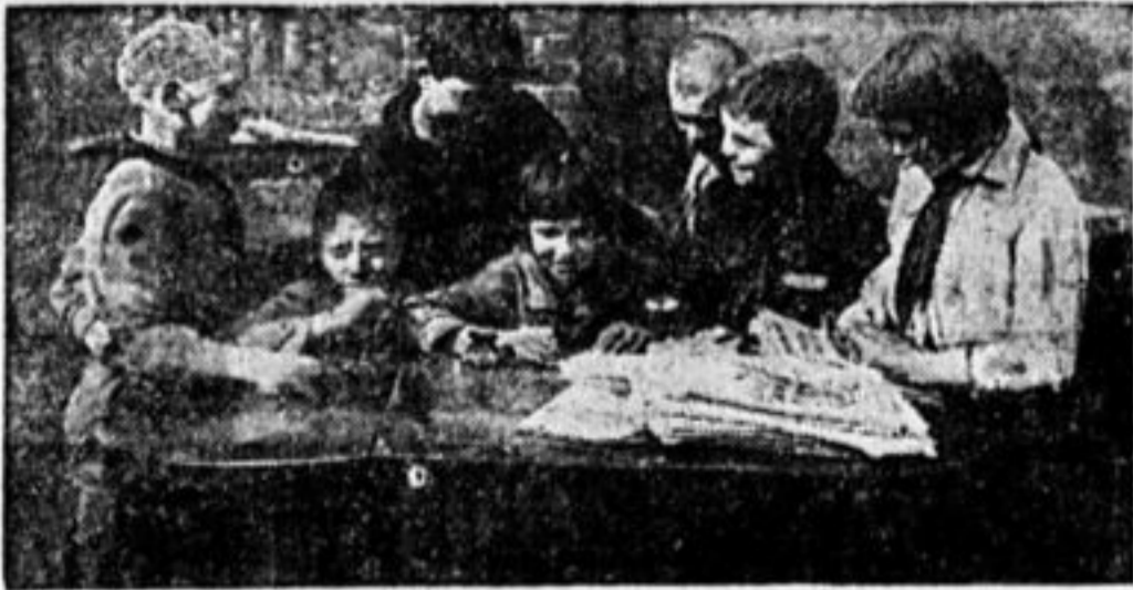
ПИШУТ ПИСЬМА ЗА ГРАНИЦУ.