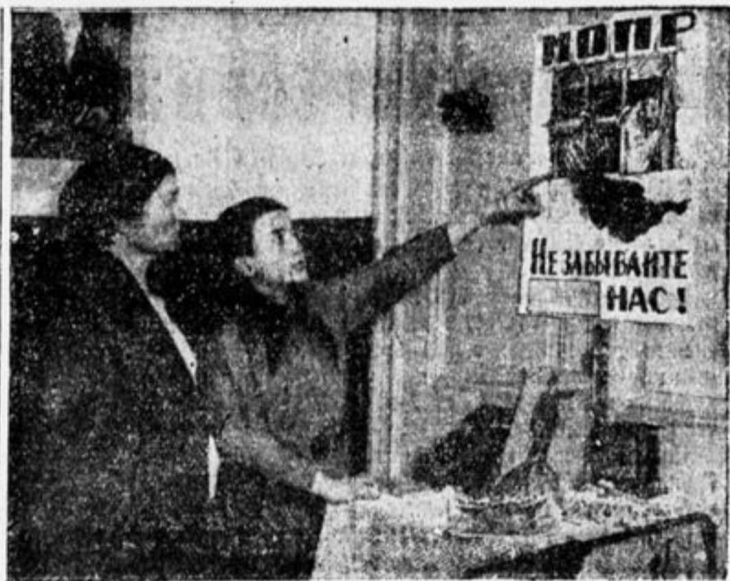
ВОВЛЕКАЙТЕ СЕМЬЮ В МОПР.

Но мало того, что все пионеры должны быть членами Мопра, — надо вовлечь