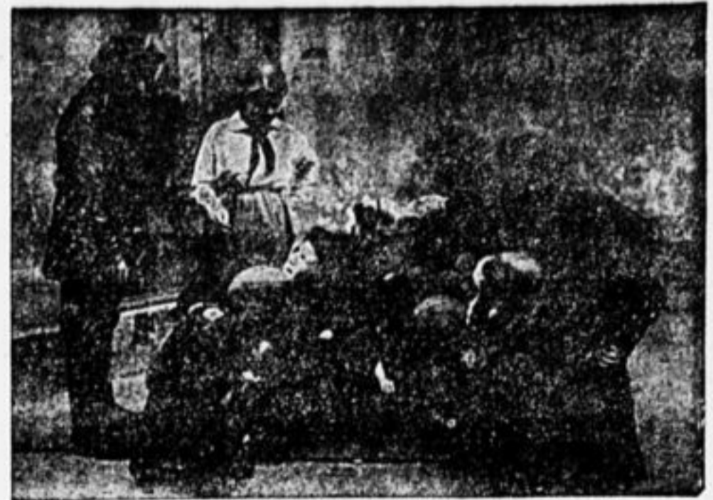
ВОВЛЕКАЮТ НЕОРГАНИЗОВАННЫХ В ОТРЯД