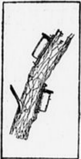
Наверху — неверно, внизу — верно.

От того, как повесить дуплянку, зависит и то, поселится в ней птица или нет. При развеске надо помнить: а) что дуплянку и скворешницу надо прикреплять, будь то к дереву, шести или дому, как можно крепче. Если же дуплянка будет шататься, то это отпугнет птицу; б) когда вешаете дуплянку, никогда не делайте так, чтобы отверстие, в которое влетает птица, было наклонном вверх. Наклон нужно делать вниз. Иначе в «глаз» будут попадать ка-