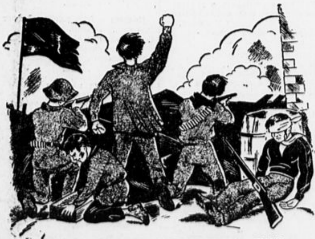
РЕБЯТА-КОММУНАРЫ НА БАРРИКАДАХ ПАРИЖА.